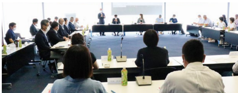
教育後援会役員会