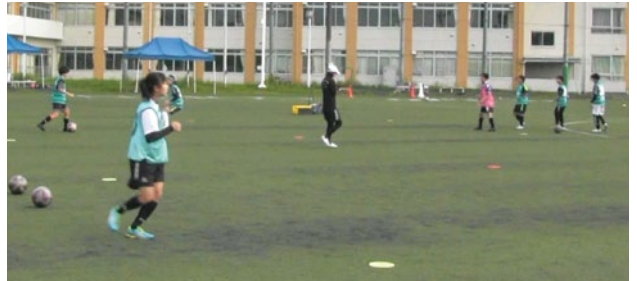
笑顔の絶えないチーム作りが目標