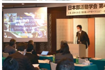
昨年の日本部活動学会研究会集の模様

本学は2019年度からスポーツ庁委託事業「運動部活動改革プラン」を受託し、大学が各教育委員会と協力して、教員を目指す学生に部活動の指導法や生徒理解、暴力・ハラスメント根絶、熱中症の予防などの知識や技能を修得してもらおうとグッドコーチ養成セミナーを定期的に行う。ここで学んだ学生らを「部活動指導員」や「外部指導者」として学校現場や社会スポーツ団体に紹介し、指導現場とのマッチングを図るシステム作りにも全国の大学で初めて取り組み、社会貢献を進める。