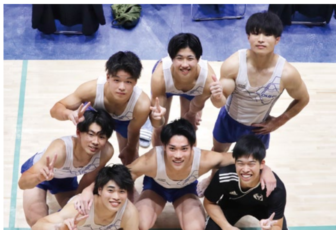
過去最高の5位となった体操競技部男子