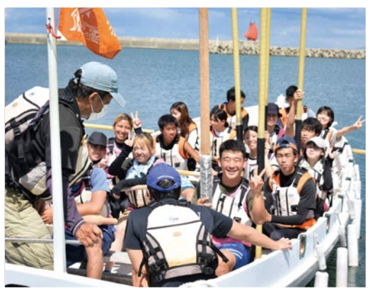
教育学部・野外活動夏季実習

教育学部の野外活動夏季実習は9月5～7日、大阪府立青少年海洋センターで開催され、1、2年生約40人が参加した。学生は初日に3班に分かれてヨット、カヌー、カッターに乗船して海上活動に取り組み、2日目はビーチで班ごとにサンドアートに挑戦。イルカや「OHS」などを砂で作った。最終日にはいかだに乗った後、ビーチバレーやビーチフラッグ競争に汗を流した。