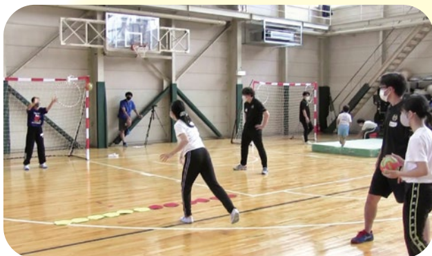
〈ハンドボール〉GKと対決