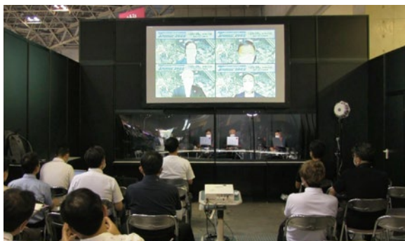
セミナーは会場からオンラインでも配信された

本学がスポーツ庁委託事業「運動部活動改革プラン」において、学生を部活動指導者として養成し、教育現場とマッチングするシステムを構築したことや、本学学生の学校現場での部活動指導の現状、部活動改革に関する国の方針や政策について解説し、体育系大学だからこそ担える部活動改革への貢献について意見を交わした。