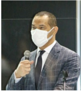
室伏広治スポーツ庁長官

原田学長は「スポーツ産業だけを伸ばして15兆円規模にできるかは疑問がある」として、スポーツ産業のパラダイムシフト（劇的な変化）が必要だと強調した。東京大会のレガシー（遺産）としての施設活用にとどまらず、ヘリテージ（継承）としてのアクティブなライフスタイル、SDGsを意識した環境行動などを提唱。官民連携によるスポーツまちづくりなどを通じたスポーツ市場からアクティブライフ市場への拡大や、スポーツコミッションが司令塔となったスポーツツクリズムによる地方創生の必要性を訴えた。