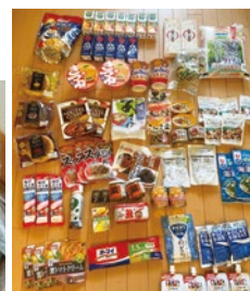
大阪市から届いたコロナ感染者への援助物資