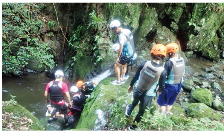
キャンプ実習・シャワークライミング