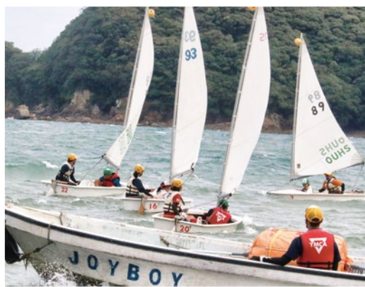
海洋スポーツキャンプ実習・ヨットを巧みに操る

9月5～11日、徳島県・YMCA阿南国際海洋センターで前後期に分けて行われた。31年前の第1回から国際海洋センターで実施。コロナ禍のため2年間は大阪府岬町での日帰りだったが、3年ぶりに本拠に戻り、2泊3日でキャンプファイアーも復活。参加者は、ヨット、ウインドサーフィン、カ