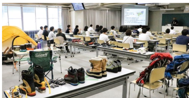
徳田講師体験授業