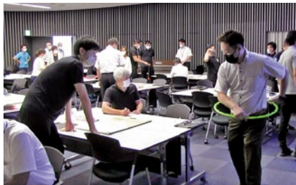
参加者はグループごとに実践的なワークに取り組んだ