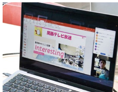
オンラインで企業から説明を受ける

関西テレビ放送、東京消防庁、鶴見製作所、ホリプロ、警視庁、ニプロ、良品計画、三井住友銀行、日東工器、北川鉄工所、ミズノ、積水ハウス、リゾートトラスト、日本通運、和泉学園（法務教官）、青年海外協力隊（JICA）、教員（小学校・中学校・高等学校・特別支援）、アルペングループ、熊取町役場、大阪体育大学大学院、海外留学