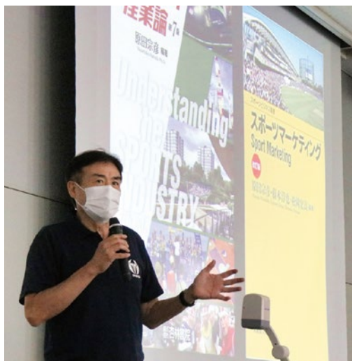
原田学長特別授業

フォトスポットやSNSコーナーでは、参加者は学生SNSチームの呼びかけで写真を撮影。学生SNSをフォローし、記念品などを受け取っていた。