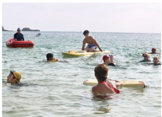
体育学部 臨海実習・最終課題の遠泳に挑む

また、教育学部には野外活動夏季実習、冬季実習があり、夏季実習が3年ぶりに実施された。