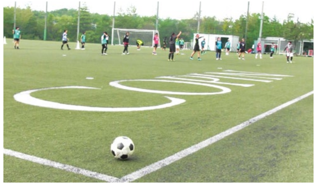
帝京大学可児高校女子サッカー部 監督