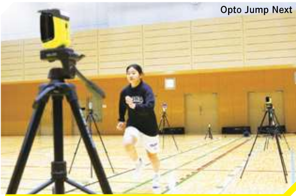
Opto Jump Next